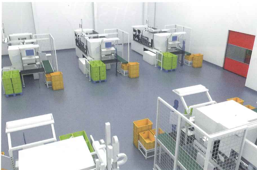
Konzept – staubfreie Produktion technischer Kunststoffartikel mit höchsten Reinraumsprüchen

Wie 2004 mit der Gründung der von Wirtschafts- und Finanzministerium geförderten Verbriefungsplattform TSI (True-Sale-International, Details vgl. Gallandi „Die Verbriefungsconnection – highway to hell“ Kapitalmarkt-Intern 2008, www.gallandi.de, Link Veröffentlichungen Nr. 57) will der Staat erneut, jetzt durch die EU-Kommission, den britischen EU-Kommissar Jonathan Hill, den Verbriefungsmarkt, den Auslöser der Finanzkrise 2007/8, fördern. „True