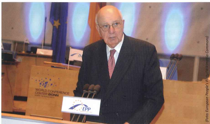
Paul Volcker brachte in den späten 70ern mit äußerst hohen Leitzinsen die US-Inflation unter Kontrolle. Unpopulär, aber wirksam.